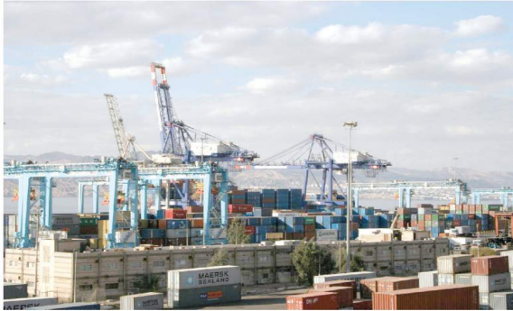
الخفض صادرات الأردن لتكفل العربية

عمان- قبلت أطرته الأردنية، ان السوق العربية تساهم، في نحو نصف صادرات الأردن، فيما تنويع باقي الصادرات على وجهات أخرى أبرزها دول أوروبا الشمالية وآسيا غير العربية. وتسبب بيانات دائرة الإحصاءات العامة الأردنية، من مجموع الصادرات الأردنية تراجع من 4.8 مليار دينار (6.7 مليار دولار) في عام 2015، إلى 4.4 مليار دينار (6.1 مليار دولار) في عام 2016، فيما بلغت قيمة الصادرات الأردنية إلى الدول العربية 2.1 مليار دينار (2.9 مليار دولار) في عام 2016، متباعدة بنحو 49% عن مجموع الصادرات في العام ذاته، رغم انخفاضها من 2.9 مليار دينار (3.3 مليار دولار) في عام 2015.