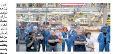
ترامب أمريكي على الطغاف السامعي في توليد الطاقة

وقال ترامب، في بيان، إن الخطة كانت «مكلفة للغاية» و«تهدد النمو الاقتصادي». وأشار إلى أن الخطة كانت تهدف إلى خفض انبعاثات الكربون من محطات الطاقة والسيارات.